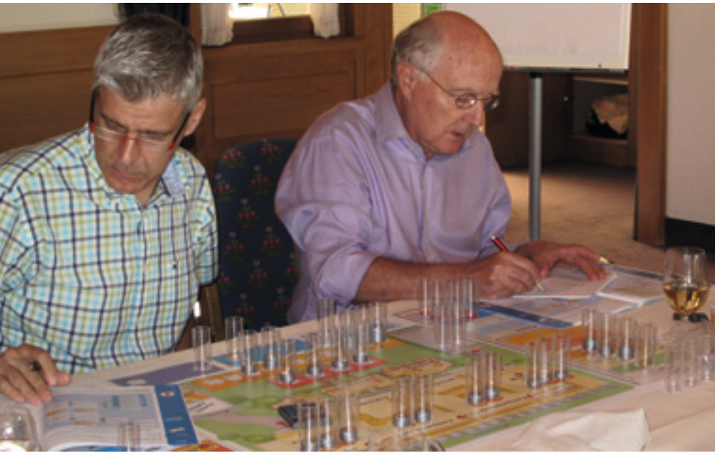
Kopf und Hand: Bei Planspielen werden Kopfarbeiten mit haptischem (physischem) Nachvollziehen spielerisch kombiniert. Nachgewiesener Lerntransfer 80%.

schweren Stufen Zielgruppen von haptischen Planspielen. Gut ausgebildete und flexible Trainer sind zudem in der Lage, bis zu 5 Gruppen beziehungsweise bis zu 20 Teilnehmende gleichzeitig durch die Planspiele zu coachen.